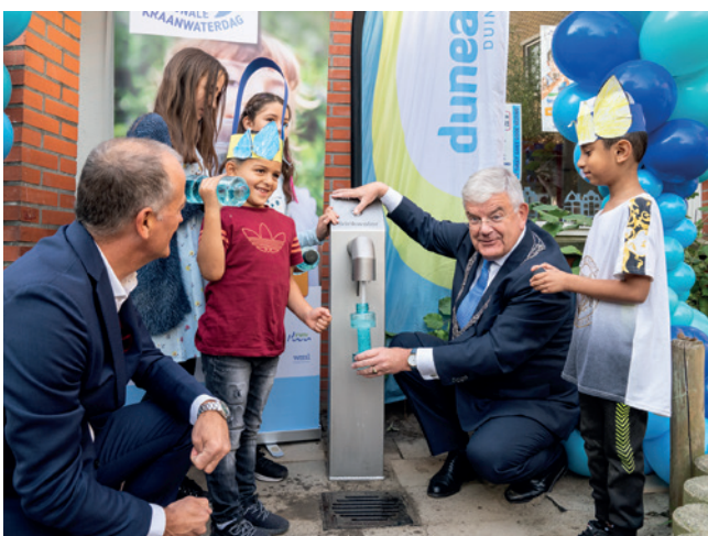
Officiële opening van een tapkraan bij basisschool 't Palet in Den Haag

Gaat uw gemeente, uw school of uw sportvereniging een duurzame samenwerking aan met Dunea, dan worden de volgende afspraken contractueel vastgelegd.